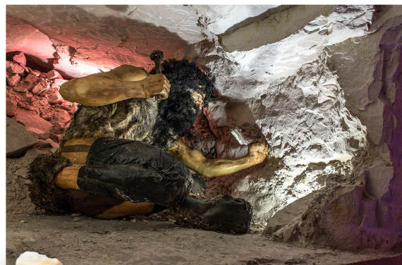
Wydobycie krzemienia w kopalni w Krzemionkach opatowskich (rekonstrukcja)

czekają na turystów w gęstej Puszczy Jodłowej (na stoku Łysej Góry), a także w okolicy Sandomierza, w Górach Pieprzowych zwanych potocznie Pieprzówkami.