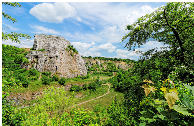
Rezerwat przyrody nieożywionej Kadzielnia

Ta niezwykła kraina od najdawniejszych czasów budziła zainteresowanie człowieka, dając mu pewne schronienie i bogactwa mineralne. Pierwsi mieszkańcy zjawili się tutaj, zanim jeszcze nauczono się wznosić domy. Dawni ludzie zasiedlili miejscowe jaskinie, takie jak jaskinia Raj , w której znaleziono ślady osadnictwa sprzed 40–50 tysięcy lat. Nazwa Raj odnosi się też do wspaniałych wytworów geologicznych – stalaktyty zwisają ze stropów, a stalagmity piętrzą się na dnie jaskini. Aby zdobyć wiedzę na temat skalnych tajemnic, warto odwiedzić Centrum Geoedukacji w Kielcach i zwiedzić okoliczny rezerwat przyrody nieożywionej Kadzielnia . Kolejne przyrodnicze atrakcje