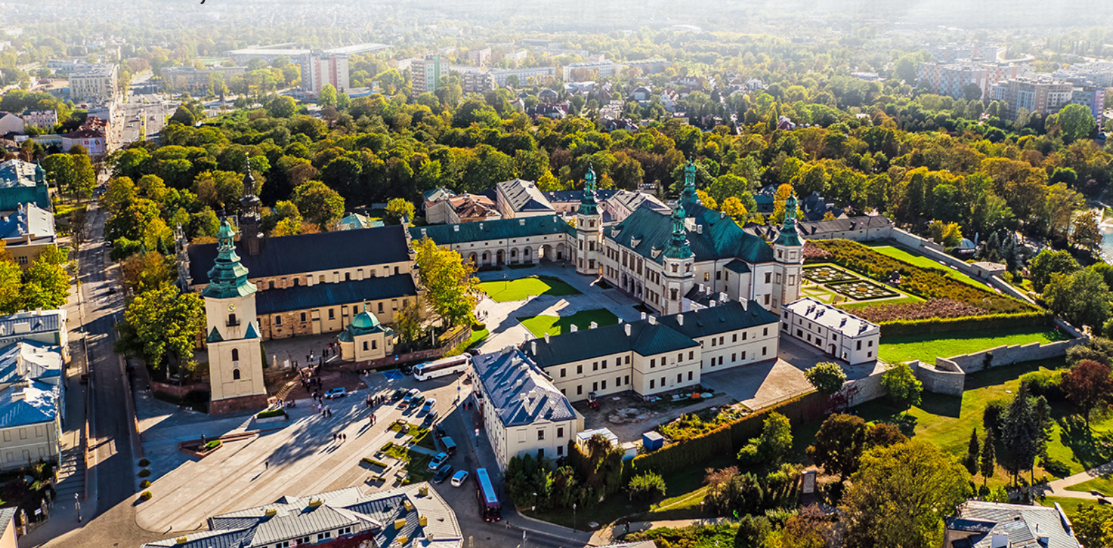
Ratusz miejski w Sandomierzu