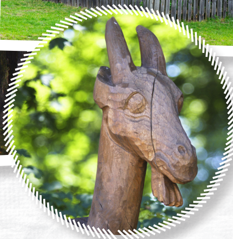
Figura Koziołka Matolatka w Pacanowie

W Muzeum Zabawek i Zabawy w Kielcach zobaczysz setki zabawek z lat dawnych i współczesnych, a także modele pojazdów, samolotów i statków. Do Pacanowa dążył zaś sam Koziołek Matolatka ; to na jego cześć wybudowano tutaj Europejskie Centrum Bajki , a nawet jego pomnik. Z kolei w Muzeum Wsi Kieleckiej w Tokarni zobaczysz, jak mieszkali dawni mieszkańcy tego regionu.